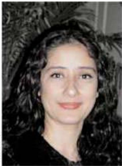
Séance dédicace pour Manisha Koirala

Faut-il encore réellement présenter Manisha Koirala et Vivek Oberoi ? La première, 34 ans, d'origine népalaise, est présente sur le devant de la scène Bollywoodienne depuis 13 ans, avec des succès tels que 7942 : A Love Story , Bombay , Khamoshi , DU Se , ou plus récemment Tum . Actrice connue et reconnue, elle souhaite aujourd'hui s'impliquer davantage dans la production et donner leurs chances à de jeunes réalisateurs. Le second, 28 ans, fils de l'acteur Suresh Oberoi, a réussi l'incroyable exploit de séduire Bollywood en moins de deux ans. Une poignée de rôles très remarquables - notamment dans Company , Saathiya et Road - lui a suffi pour obtenir la reconnaissance de toute la profession et s'imposer d'évidence pour longtemps sur le grand écran. Rencontre avec les deux stars, au rythme de la sympathie et de la bonne humeur.